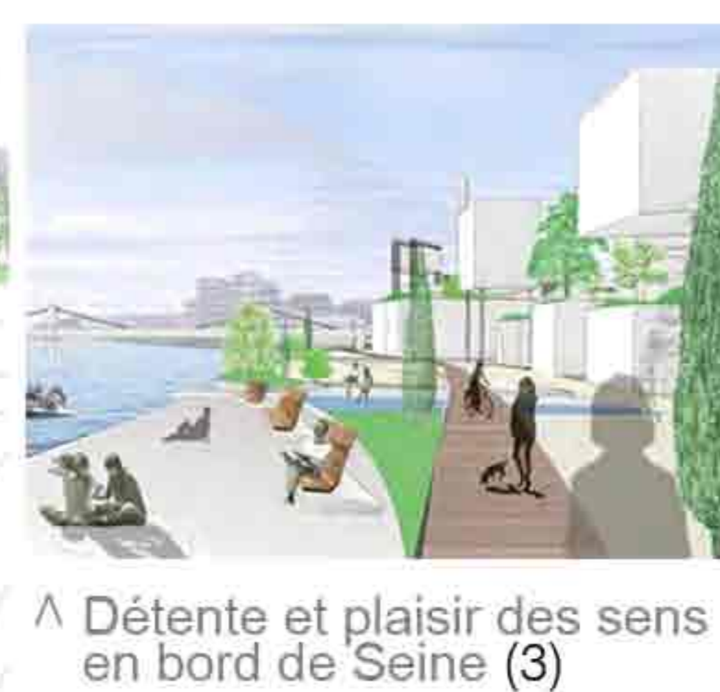
^ Détente et plaisir des sens en bord de Seine (3)