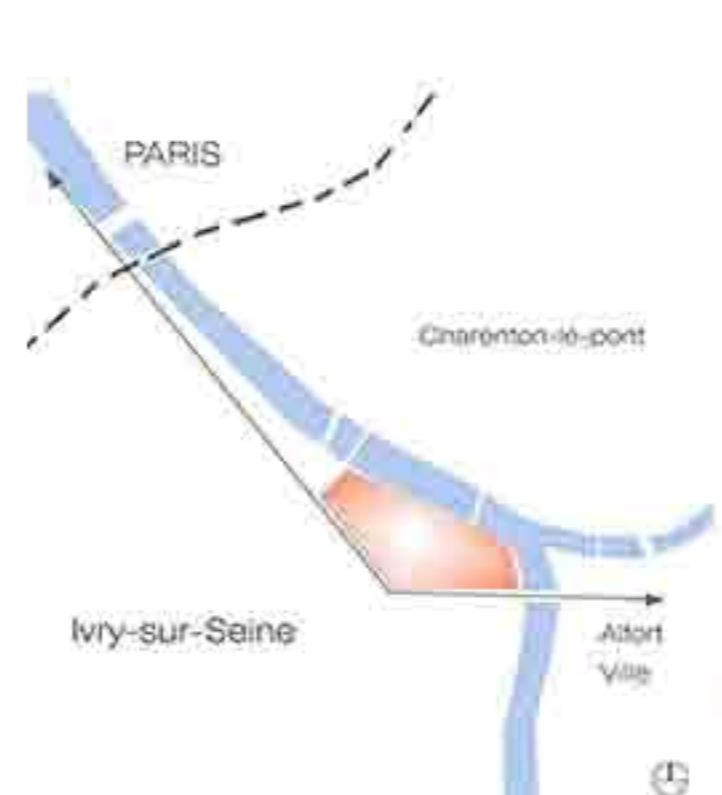
> La nature à deux niveaux de référence (2)