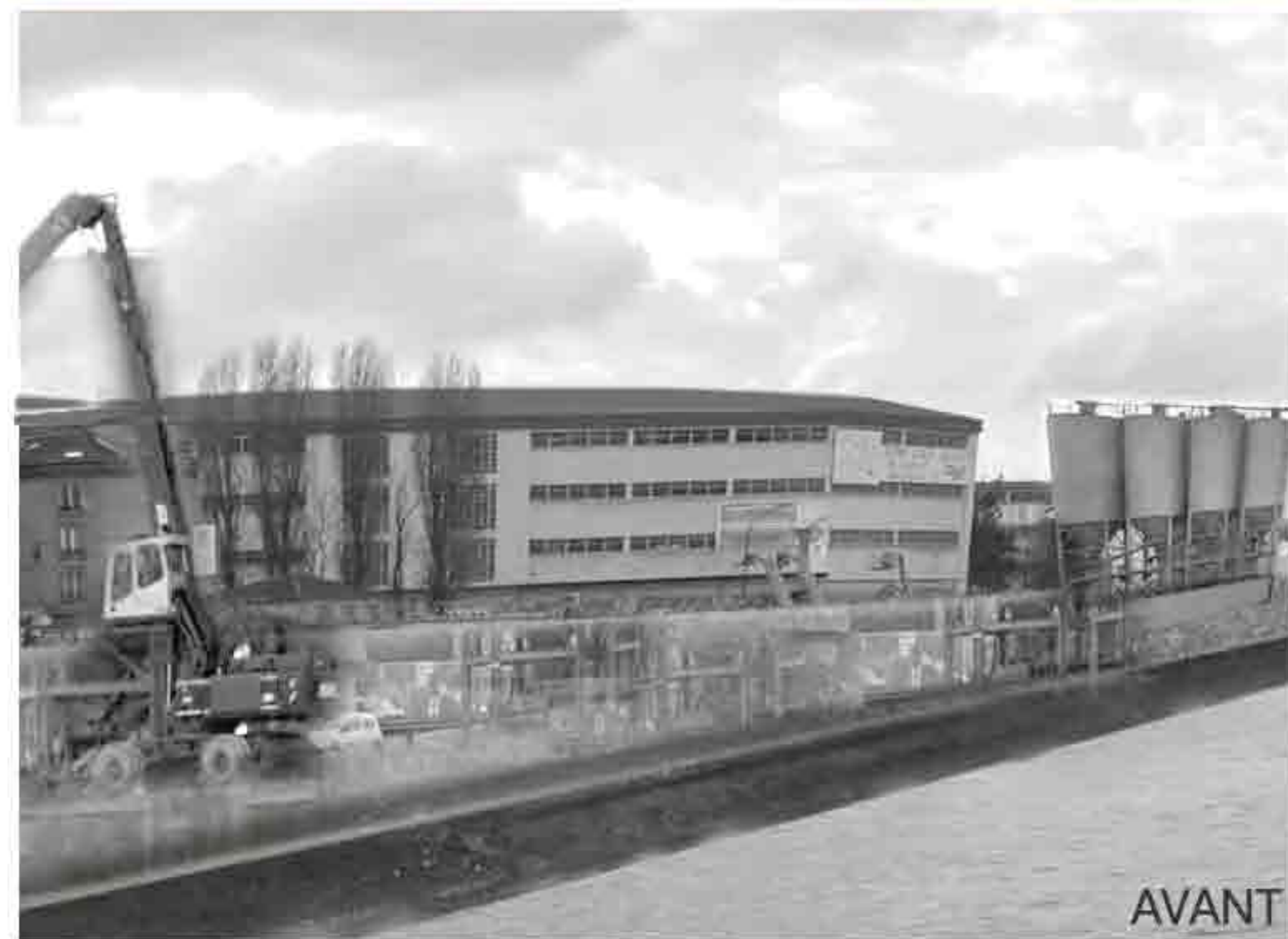
^ Bâtiment emblématique entre nature et densité, ancien et nouveau, espaces privés et espaces publics (1)