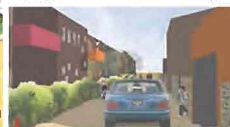
la rue comme lieu de vie