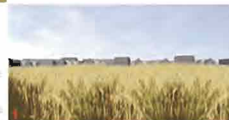
un horizon de ville à travers champs