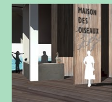
2b-Hall d'accueil de la maison des oiseaux