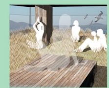
2a-Se percher dans les nuages