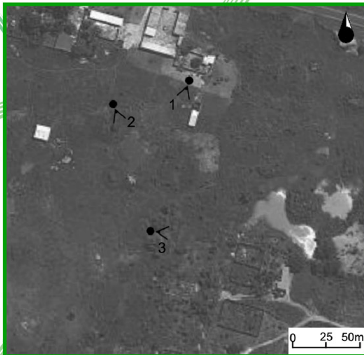
0 25 50m

Les tamberma sont un peuple du Nord du Togo dont la diversité culturelle est classée patrimoine mondial de l'UNESCO. Ce peuple a développé une organisation de l'espace et mode de vie tout à fait visionnaire