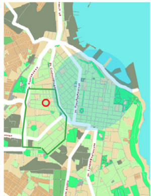
Plan du territoire M 1 : 50000