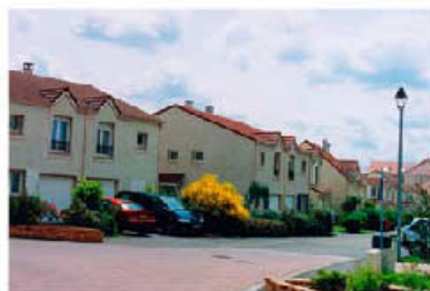
Les maisons individuelles