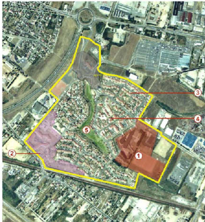
2001, Le quartier nouveau