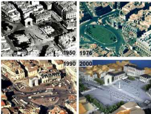
Place de la victoire (2), 2000 : Projet Lauréat - Atelier Bernard Huet +