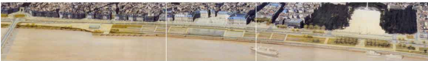
Front bâti sur la Garonne et aménagement des quais, projet lauréat : équipe Claire et Michel Corajoud, paysagistes