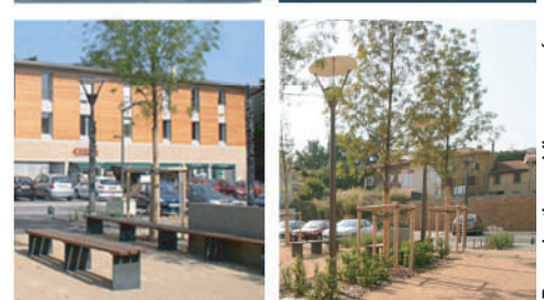
3- Place basse (Place du Général de Gaulle)