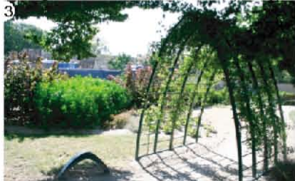
3 Jardin de l'Hors du Rû (Piery)