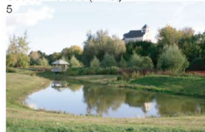
5 Jardin Humide (Chouilly)