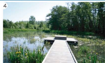
4 Gué du Pré Salé (Pivot)