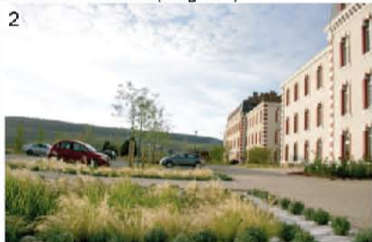
2 Parking de l'Hôtel de Communauté (Epernay)