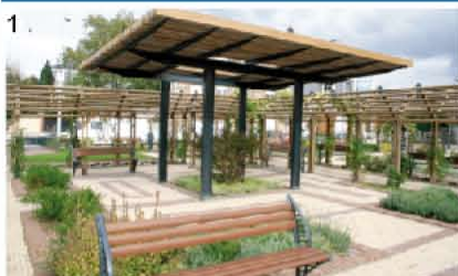
1 Place de la Mairie (Magenta)