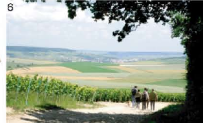
6 Réseau de circulations douces (territoire entier)