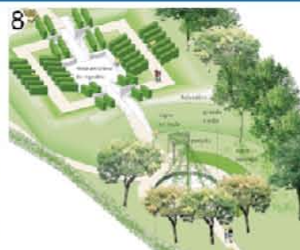
8 Jardin de Vignes (Chouilly)