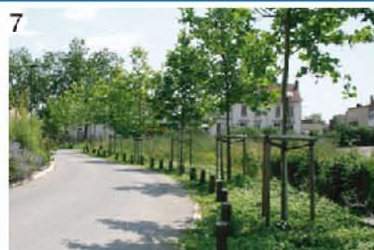
7 Val de Champagne (Epernay)