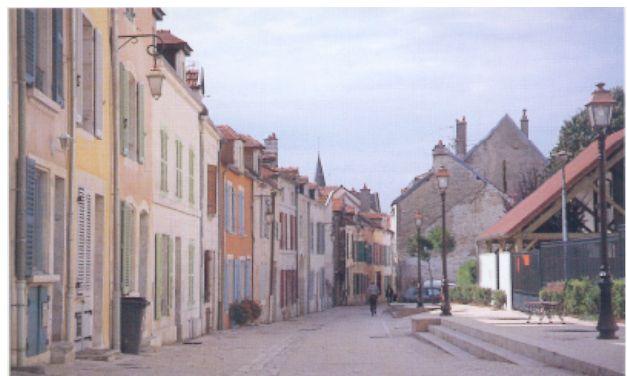
Plan 1- vue générale de la rue Juvet 2 - Vue sur les jardins à l'arrière des immeubles 3 - Passage piéton au travers des immeubles