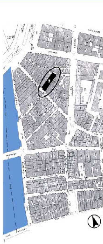
Immeuble PORT L'ENSEIGNE 23, rue Bourgneuf - Bayonne