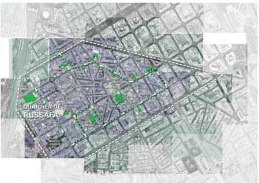
échelle: 1/10000 Plan du territoire APRES