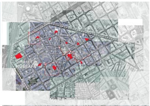
échelle: 1/10000 Plan du territoire AVANT

Le site: Malgré les tentatives pour réformer Rus-safa et l'intégrer comme partie prenante de la ville, le quartier est devenu marginal. Tant au niveau social qu'urbanistique, les grands axes qui articulent la ville transforment le quartier en une île urbaine. La transformation du village en ville et l'augmentation de la population ont provoqué une plus grande circulation et l'apparition progressive de commerces, excessifs dans certaines zones. Tout ceci a entraîné la détérioration de l'image du quartier; des terrains vagues attendent d'être occupés et dégradent la qualité de l'environnement. Le caractère attractif du quartier, sa grande richesse multiculturelle, contraste avec le manque criant de zones vertes.