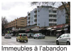
Immeubles à l'abandon