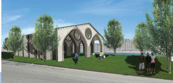
Revivification des monuments à destination du public

Le quartier tirera profit d'un marché permanent et moins engorgé, et d'un meilleur accès aux espaces verts et au Tibre.