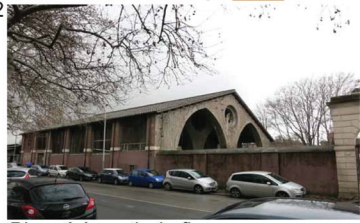
Bloqué à partir du fleuve