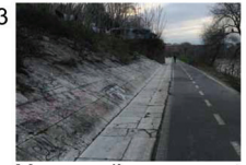
Manque d'espace vert