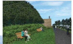
Connexion vers le fleuve