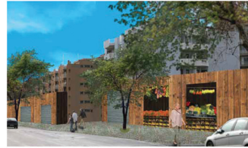
Nouveaux espaces permanents pour les commerces

La nature dégarinée du site de Porta Portese sera améliorée grâce à la ré-introduction d'un espace vert ouvert : arbres, massifs d'arbustes, et zone riveraine le long du Tibre.