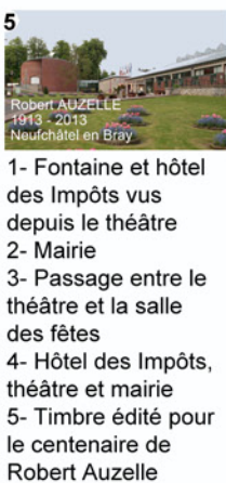
1- Fontaine et hôtel des Impôts vus depuis le théâtre 2- Mairie 3- Passage entre le théâtre et la salle des fêtes 4- Hôtel des Impôts, théâtre et mairie 5- Timbre édité pour le centenaire de Robert Auzelle