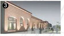
la construction de lieux de recyclage à la gestation des entreprises, des bars, des centres communautaires et culturels