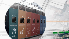
centres de recyclage