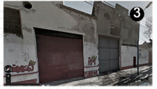
bâtiments endommagés entrepôts et un parking et autobus et les camions