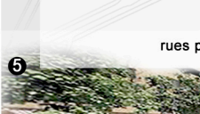
rues piétonnes cyclistes