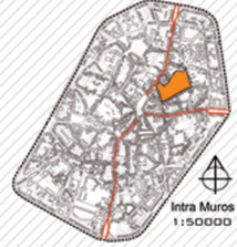
Intra Muros de Mons 1:50000