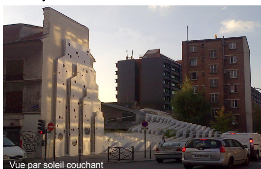
Vue par soleil couchant