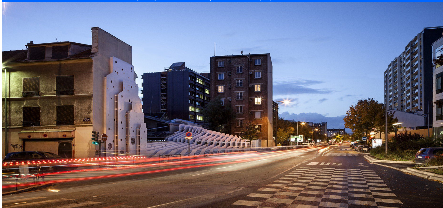
Vue de nuit : 15 et 17 rue Martre