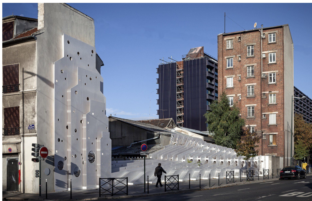
Vue de jour