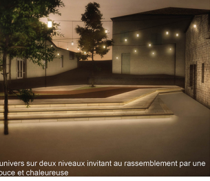
16. Deux univers sur deux niveaux invitant au rassemblement par une lumière douce et chaleureuse