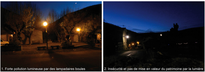
1. Forte pollution lumineuse par des lampadaires boules

Penne est une bourgade médiévale. L'atmosphère y est bucolique, la nature est très présente à travers une minéralité érodée et une végétation non maîtrisée.