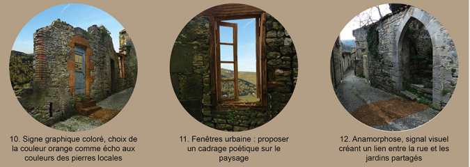
10. Signe graphique coloré, choix de la couleur orange comme écho aux couleurs des pierres locales