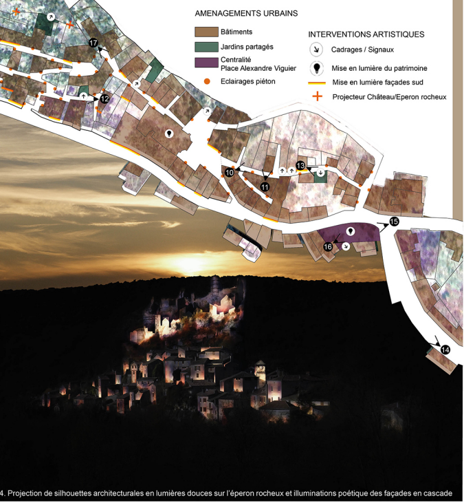
14. Projection de silhouettes architecturales en lumières douces sur l'éperon rocheux et illuminations poétique des façades en cascade

rythmée, sensible et poétique. Utiliser la typologie angulaire du village comme plasticité. Tenir compte de la qualité architecturale (A) , le respect de l'environnement (B) et la qualité de vie sociale (C) .