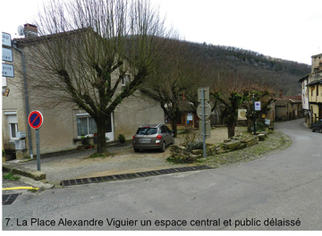
7. La Place Alexandre Viguier un espace central et public délaissé