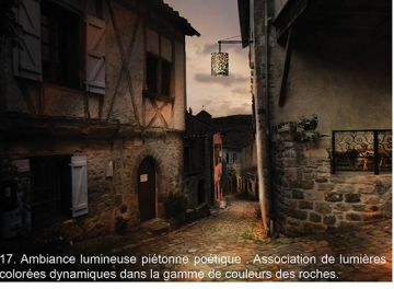
17. Ambiance lumineuse piétonne poétique - Association de lumières colorées dynamiques dans la gamme de couleurs des roches