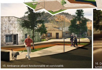
15. Ambiance alliant fonctionnalité et convivialité.

C. Réaffirmer la «place du village» Deux espaces distincts définis par un travail graphique du sol