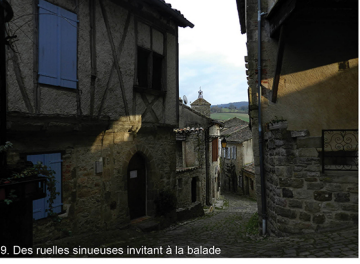
9. Des ruelles sinuuses invitant à la balade