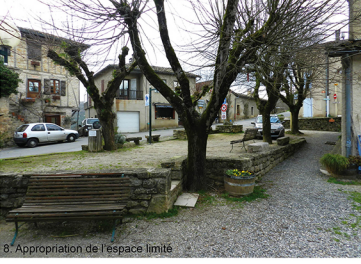
8. Appropriation de l'espace limité