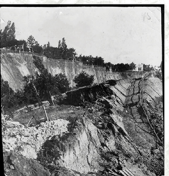
Le glissement de terrain sont le problème de toute l'histoire d'Odessa

CODE GÉNÉTIQUE D'ENDROIT Le code génétique de la ville portuaire d'Odessa est prédéterminé par la mode de pensée noosphérique de ses fondateurs (François-Paul Sainte de Wollant, José de Ribas); par les compétences suprême du développement social et naturel du monde; par la création du cadre de vie qualitatif