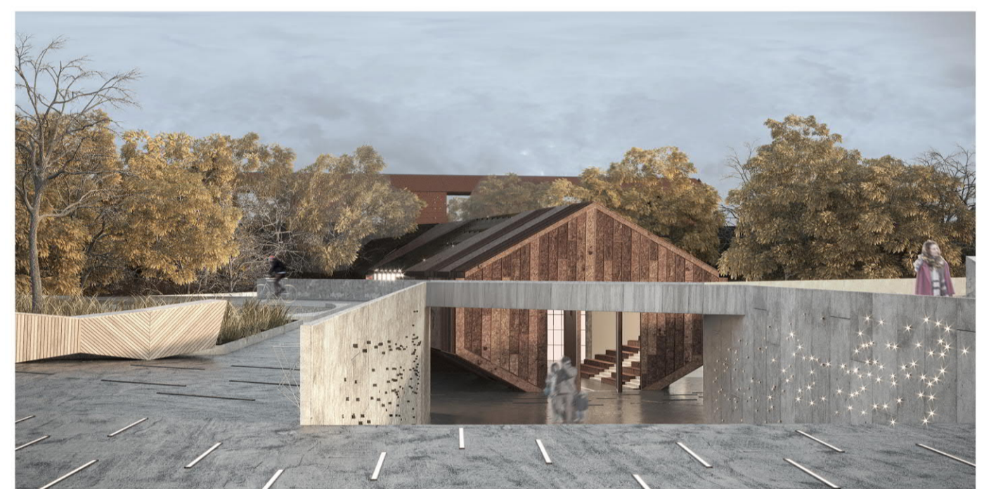
1. La nouvelle hypothèse permet à tous les utilisateurs de l'utiliser.