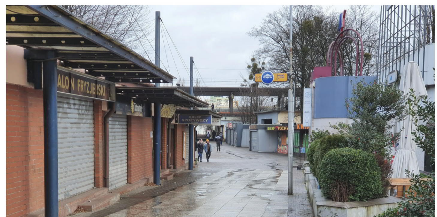
1. Actuellement, le chaos urbain dominant décourage les utilisateurs.