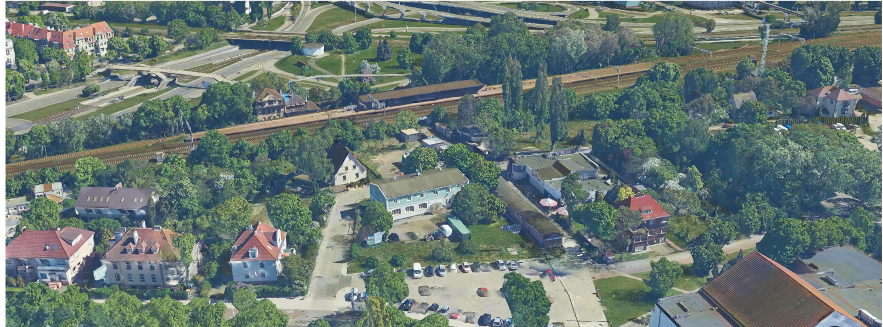
Vue d'en-haut, avant.