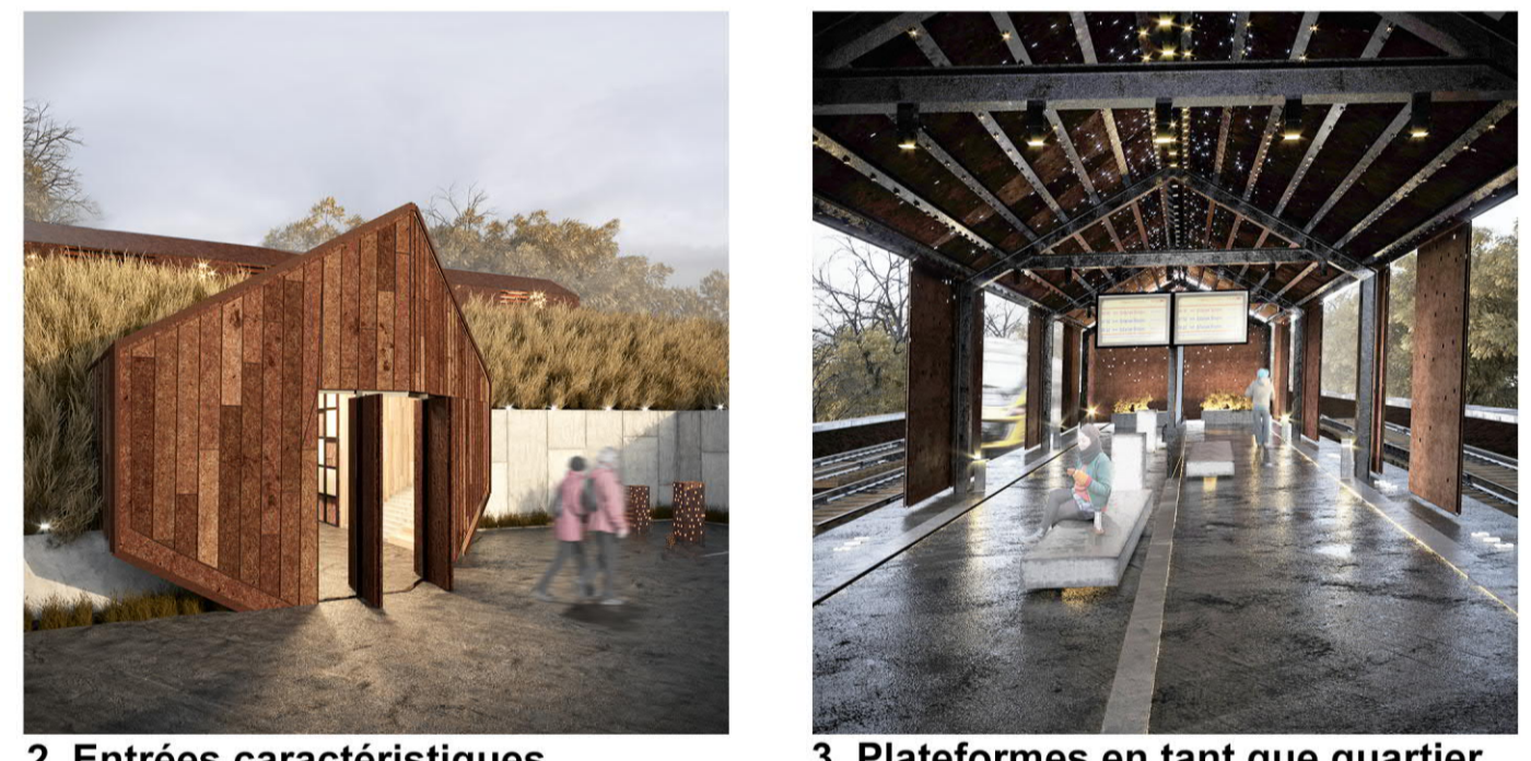
2. Entrées caractéristiques. 3. Plateformes en tant que quartier.