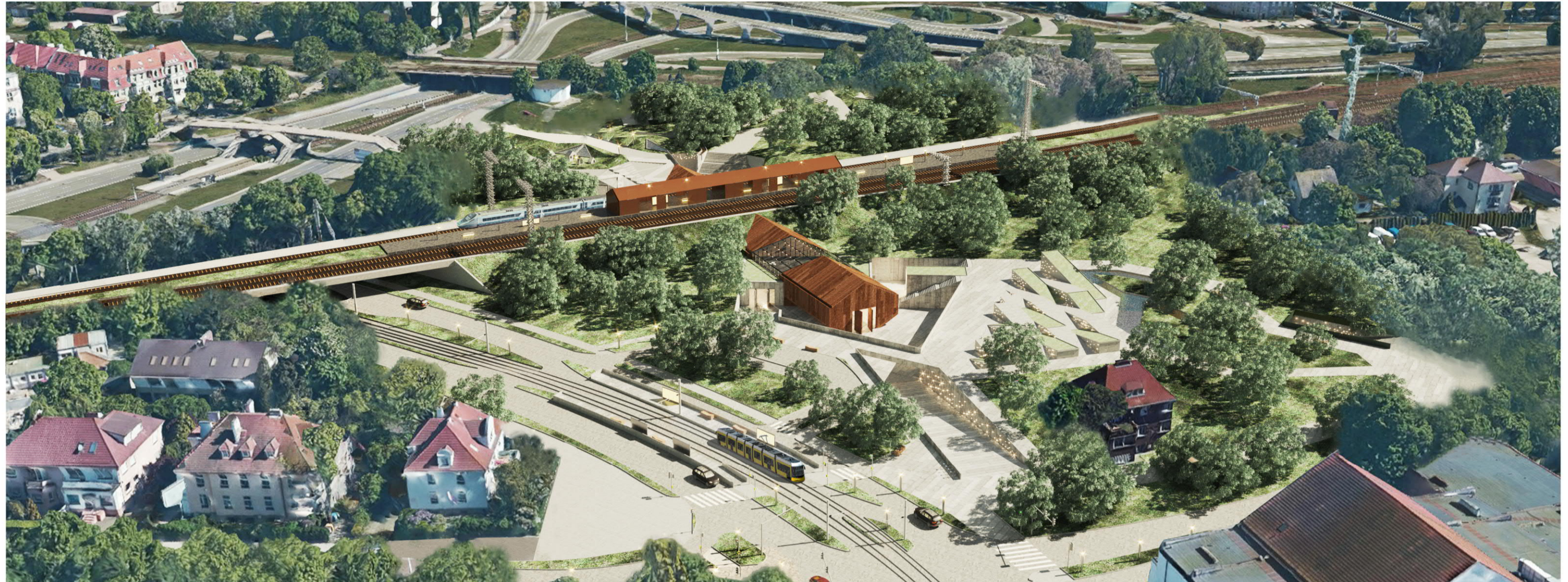
Vue d'en-haut, après.