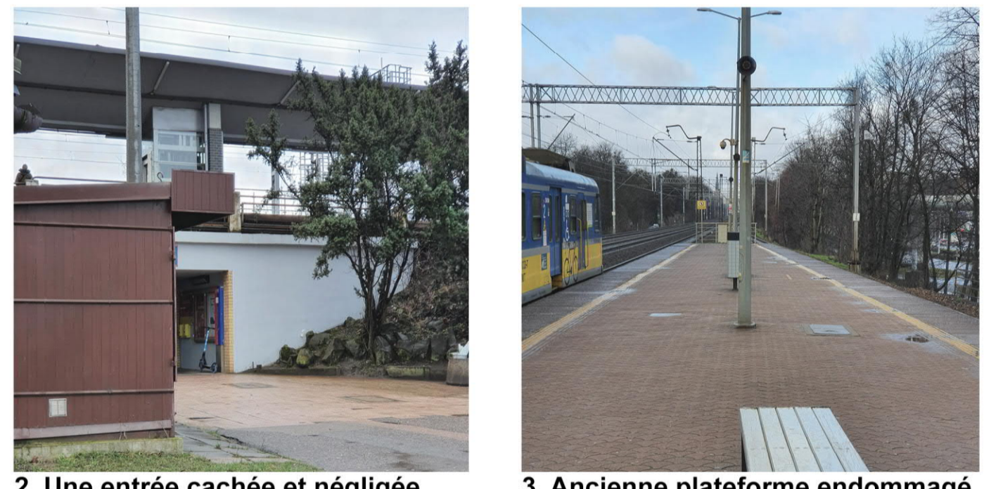
2. Une entrée cachée et négligée. 3. Ancienne plateforme endommagé.