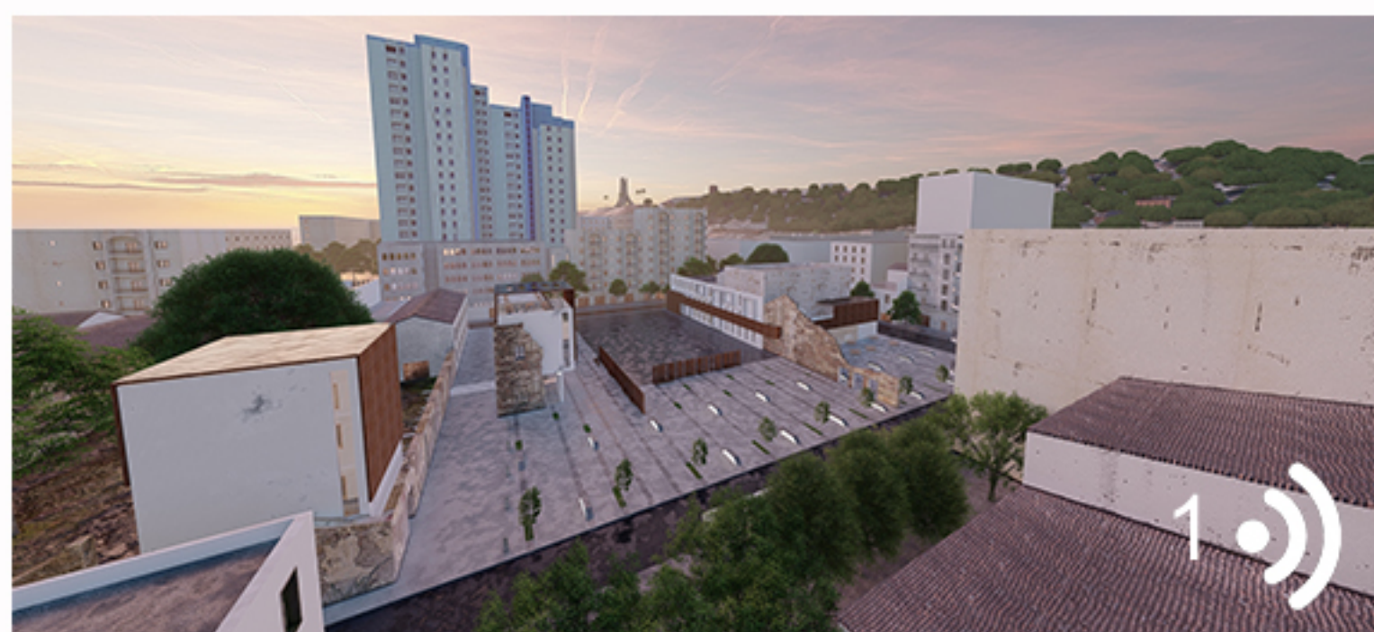
Projet après intervention