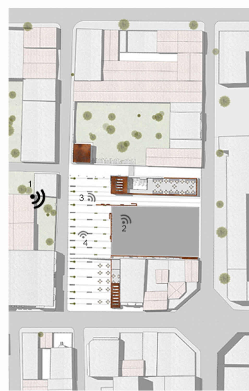
(4) Plan de masse après intervention de l'action parasitaire