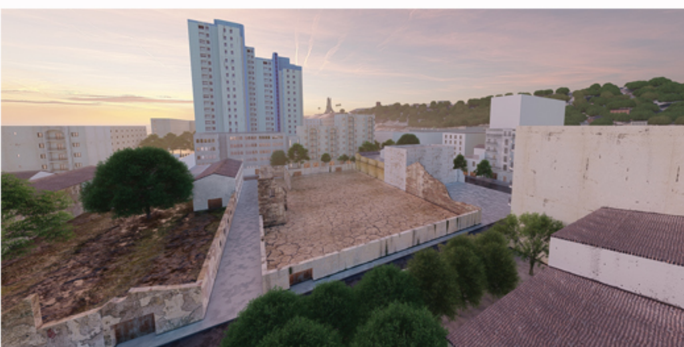
Projet avant intervention