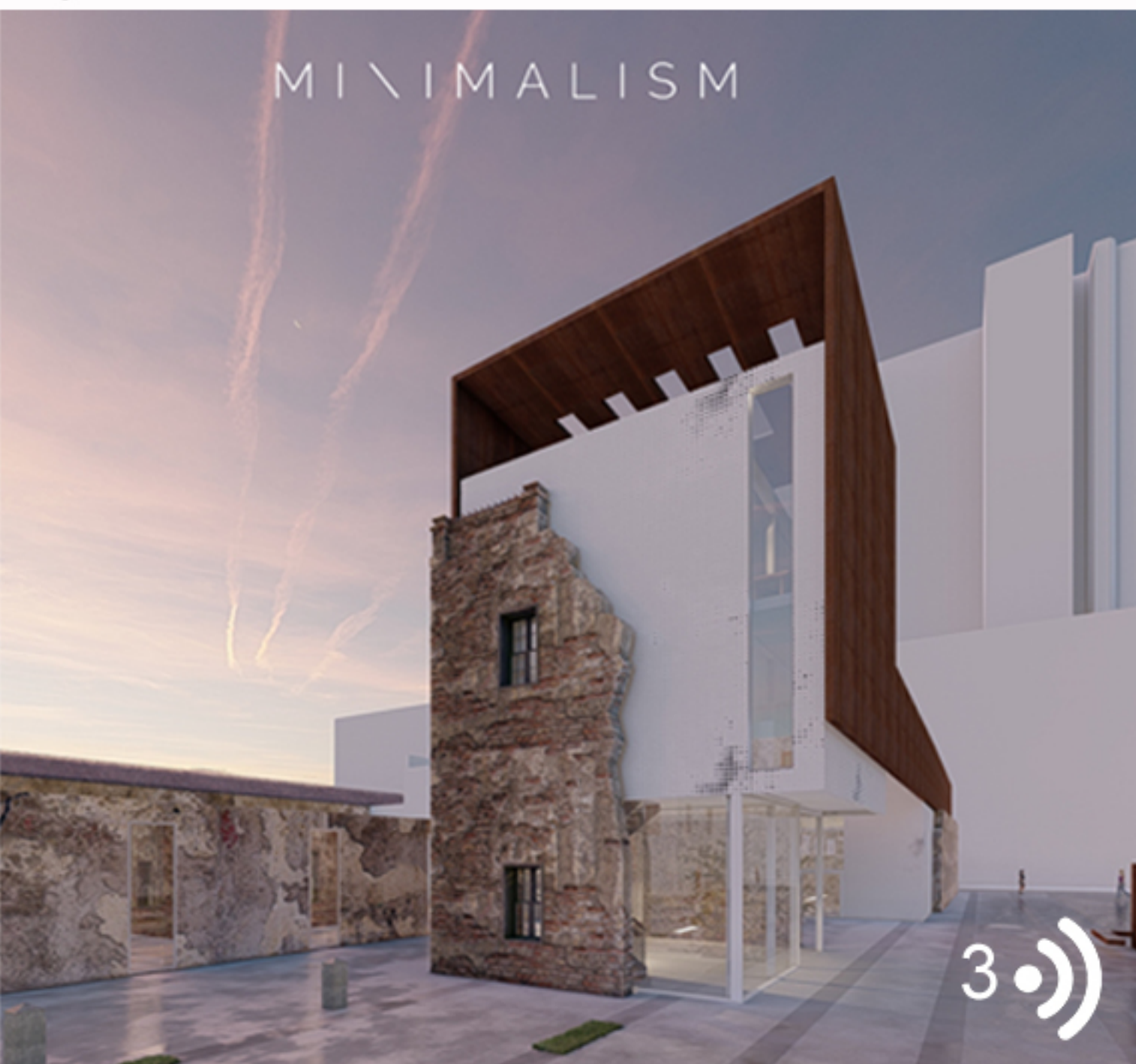
Vue sur la librairie d'antiquaire