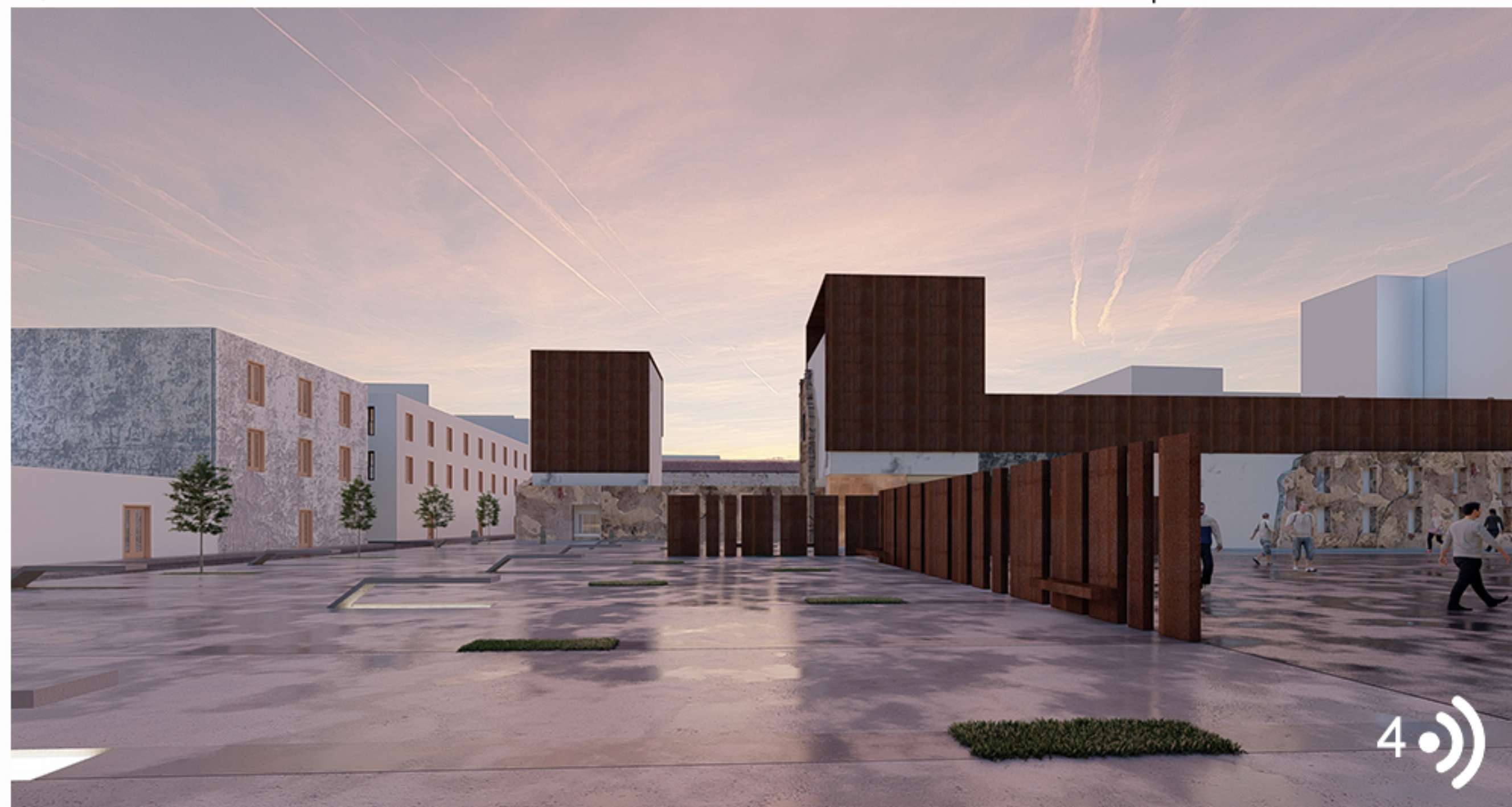
Vue sur l'espace public