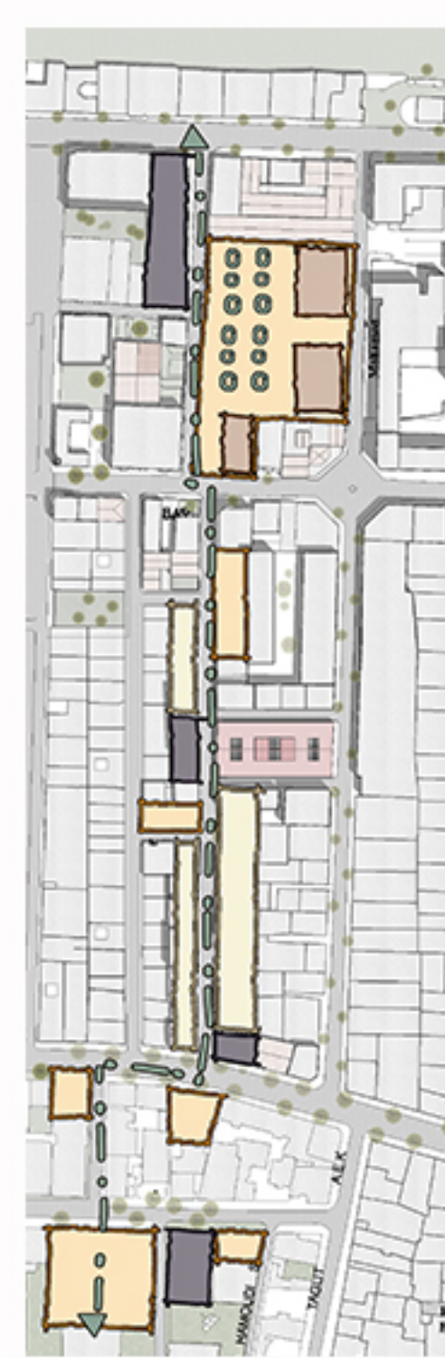
(3) Plan de masse de la prospective