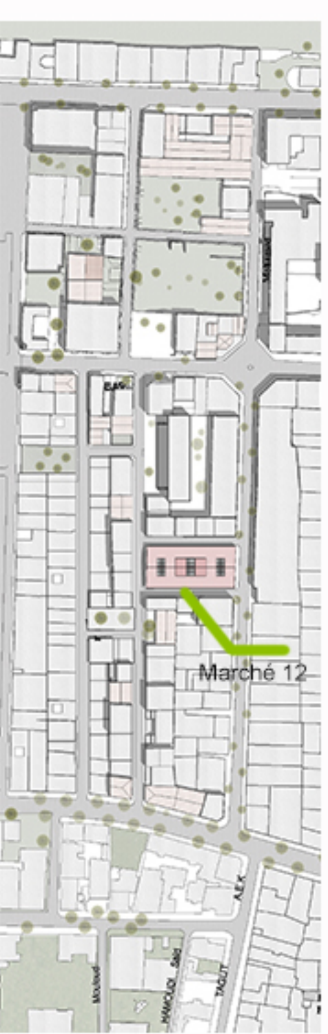
(1) Plan de masse avant intervention