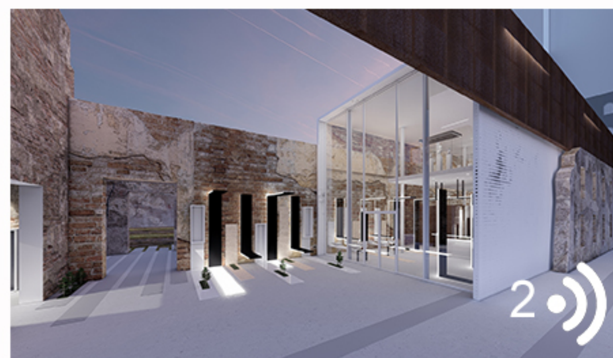
Vue sur l'atelier d'antiquaire