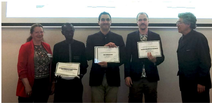
Les lauréats du Concours international et leurs enseignants.