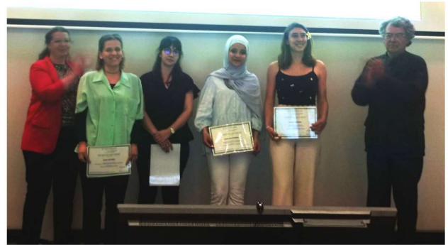
Les lauréats des Bourses de l'Art Urbain