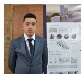
Said MIZI Architecte EPAU d'Alger